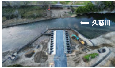
▲施工途中の渡河施設