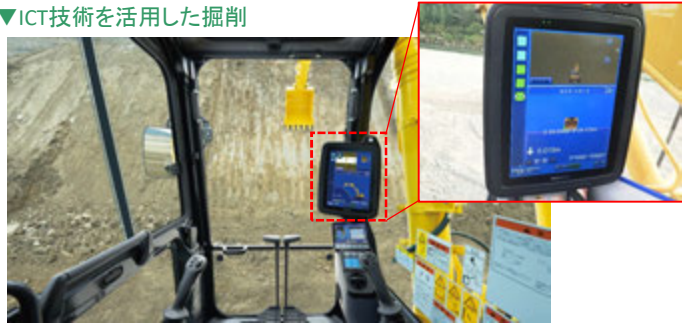
▼ICT技術を活用した掘削

○ICT技術を活用し、3次元測量データから掘削範囲や掘削高を自動測定しモニターに表示することや、重機をセミオートで操縦することができ、掘削作業が大幅に効率化しました。