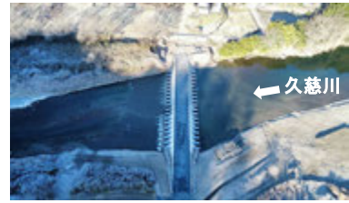
▲完成した渡河施設