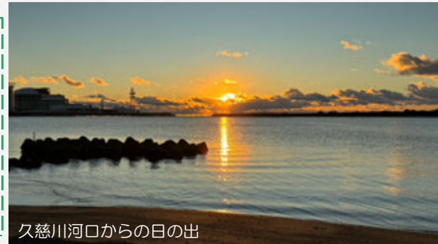
久慈川河口からの日の出

ともに築こうまち・みらい 編集・発行 国土交通省 常陸河川国道事務所 国土交通省 久慈川緊急治水対策河川事務所